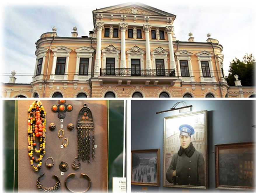
(Музей Дом Мешкова, г.Пермь ул. Монастырская д.11)

У каждого города есть то самое особое место, по которому его узнают жители других населенных пунктов. Место, которое имеет особенное значение для каждого горожанина, и является поводом для его гордости. Этой достопримечательностью является Пермская Государственная Художественная галерея, в которой находится богатейшее собрание работ художников и скульпторов со всего мира. Коллекции составляют около 50 000 произведений изобразительного искусства с древнейших времен до современности, представляющих различные виды искусства.