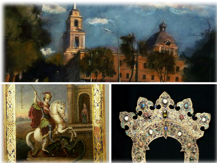
(Пермская Государственная Художественная Галерея, г.Пермь., Комсомольский проспект,д.4 ).

У каждого города есть то самое особое место, по которому его узнают жители других населенных пунктов. Место, которое имеет особенное значение для каждого горожанина, и является поводом для его гордости. Этой достопримечательностью является Пермская Государственная Художественная галерея, в которой находится богатейшее собрание работ художников и скульпторов со всего мира. Коллекции составляют около 50 000 произведений изобразительного искусства с древнейших времен до современности, представляющих различные виды искусства.