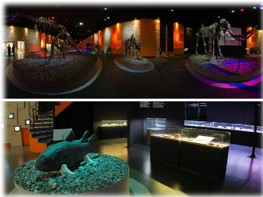
(Музей Пермских древностей, г. Пермь ул. Сибирская, д.15)

Первобытный дух живет не только в Пермском крае, но и в центре самой Перми. Это наглядно демонстрируют Музей Пермских Древностей и экспозиции в пермском музее Дома Мешкова.